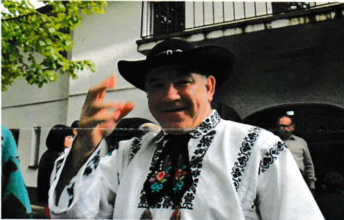
Weißkircher Treffen 2013